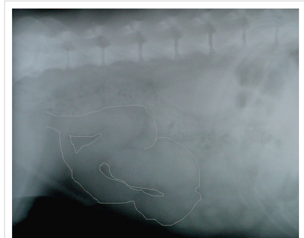
Röntgenaufnahme einer Pyometra beim Hund. Die Gebärmutter befindet sich als schlauchartige Struktur unten in den beiden linken Bild Dritteln (zur Verdeutlichung mit Linien markiert).

Im weiteren Verlauf ist oftmals blutig-eitriger, teils übelriechender Vaginalausfluss feststellbar – es hat sich eine offene Pyometra ausgebildet. Tiere mit dieser Form der Erkrankung säubern sich für den Beobachter auffällig häufig den Genitalbereich durch Belecken. Die Diagnose kann meist schon anhand der klinischen Symptomatik erfolgen, die endgültige Abklärung erfolgt mittels Ultraschall- oder Röntgenuntersuchung. Bei der Blutuntersuchung zeigen sich häufig eine Leukozytose mit Linksverschiebung und erhöhte Harnstoffwerte. In einem Großteil der Fälle sind im abfließenden Sekret Bakterien, hier vor allem E. coli , Staphylococcus intermedius und Streptokokken nachweisbar.