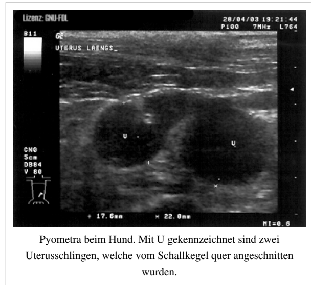
Pyometra beim Hund. Mit U gekennzeichnet sind zwei Uterusschlingen, welche vom Schallkegel quer angeschnitten wurden.

Im Zusammenhang mit vom normalen Sexualzyklus abweichend häufig wiederkehrenden Läufigkeiten und verstärkten oder übermäßig abgeschwächten Scheinträchtigkeitssymptomen besteht ein erhöhtes Risiko der Ausbildung einer Pyometra, da diese Symptome hinweisend für eine hormonelle Störung sein können.