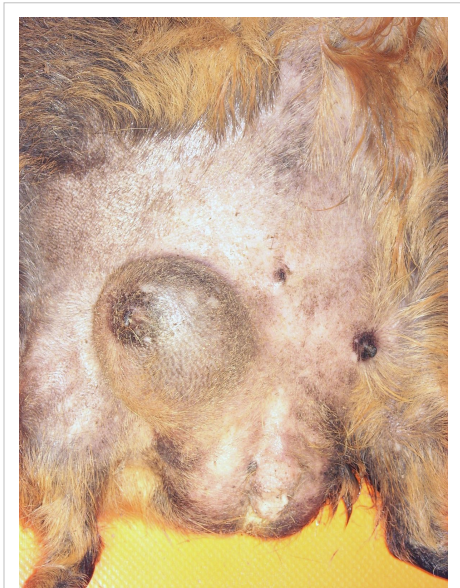
Mammatumor bei einem Meerschweinchenbock

Die Brusttumoren von Ratte und Maus, die in der Forschung, zur Erforschung des Brustkrebs Verwendung finden, sind in der Regel gutartig und bilden keine Metastasen. Es wird aber versucht, zu Forschungszwecken metastasierende Gesäugetumoren bei Ratte und Maus zu entwickeln. Die Behandlung der Wahl des Gesäugetumors ist die Operation. Bei hoher Malignität ist eine anschließende Chemotherapie angezeigt, wobei häufig Doxorubicin-basierte Chemotherapieprotokolle zum Einsatz kommen.